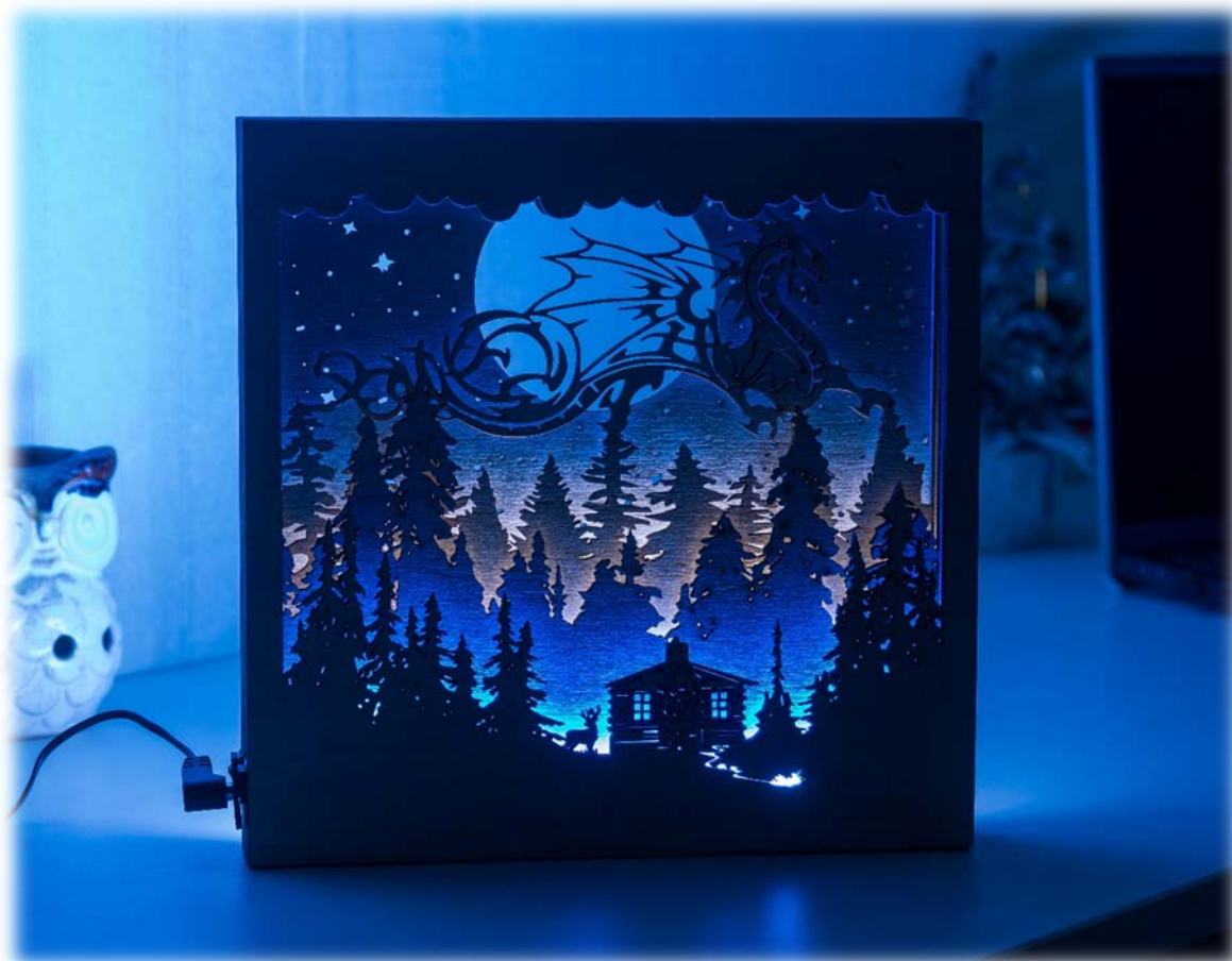
Светильник "Ночной полет"