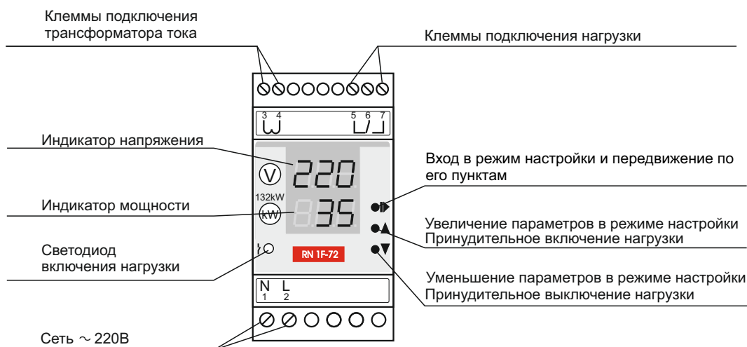
Рис. 1. Устройство прибора

ВНИМАНИЕ! При скачкообразном превышении мощности более 30% от установленного значения, независимо от времени t4 произойдет отключение исполнительного реле через 0,1 сек.