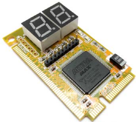
Общий вид устройства. Рис.1

Описание широко распространенных POST кодов можно найти на странице устройства сайта http://www.masterkit.ru