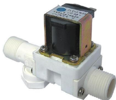
Рис. 1. Общий вид.

Широкое применение клапан может найти в системах «умный дом» (например в составе VM8039D), домашней автоматике, дачных бассейнах, системах автоматического полива, аквариумах и т.п.